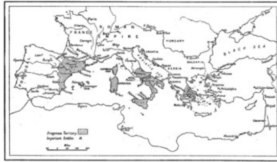
MAP 1. THE ARAGONIAN EMPIRE AT ITS GREATEST EXTENT

Vi hänvisar till en litteraturförteckning med ett urval av böcker från biblioteket hos Ordens kansli. Förteckningen är inte avsedd att vara fullständig.